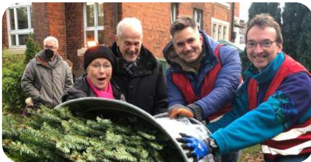
Weihnachtsbaumverkauf 2023 an der Friedenskirche

Auf dem Programm stehen Stücke aus mehreren Jahrhunderten, vor allem aber sind es zeitgenössische Komponisten (z.B. John Leavitt oder Karl Jenkins), deren Lieder gesungen werden.