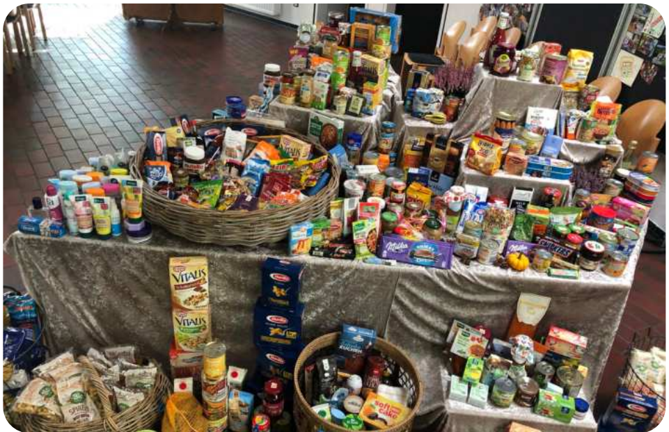
Erntedanktisch in der Friedenskirche

tel, Hygieneartikel und ähnliche Dinge mitbringen, die wir dann nach dem Erntedankfest an die Tafel übergeben werden.